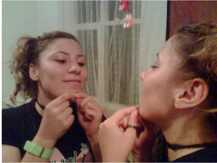
Fotoğraf 4.2:Gençleri rahatsız eden ergenlik dönemi sivilceleri( Akneler )sağlıklı beslenme ile azaltılabilir. Yağlı gıdalardan fazla tüketilmemeli ve sivilcelerle oynanmamalıdır

Çocukluktan yetişkinliğe geçiş dönemi ergenlik dönemi, olarak adlandırılır. Kızlarda 11-18, Erkeklerde 13-18 yaşlar arasını kapsar. Büyüme ve gelişmenin hızlı olduğu bir dönemdir. Ergenlik döneminde boy ve kilo hızla artar. En hızlı büyüme kızlarda 10-12 yaşta, erkeklerde ise yaklaşık 11-14 yaşında başlar. Kızlarda vücut ağırlığı ve boy uzunluğunda artış mensturasyondan (ilk adet kanaması) bir yıl öncedir. Vücut ağırlığındaki artış yaklaşık 20 yaşına kadar devam eder. Boy uzunluğunda artış ise kızlarda 17 yaştan sonra genellikle durur; fakat erkeklerde yavaşta olsa devam eder Yaşam boyu sürebilecek davranışlar oluşmaya başlar. Vücudun şeklinde cinsiyet hormonlarına bağlı olarak farklılaşma görülür. Vücudun yağ dokusunda, kas ve kemik yapısında değişiklikler olur. Kız çocuklarında göğüs ve kalçalar belirginleşir. Erkeklerde vücut adaleli bir görünüm alır.