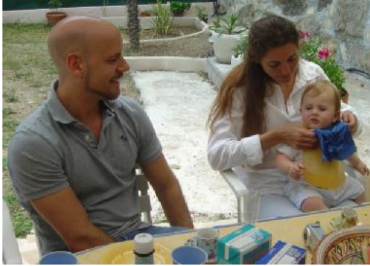
Fotoğraf 1.4 : Baba da bebeğin temel ihtiyaçlarını karşılamada yer almalıdır