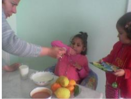
Resim 2.9: Yemek seçen çocuk, yemediği yemekler için zorlanmamalıdır

Yemek seçen çocuk yemediği yemekler karşısında zorlanmamalı, çocuğa aynı besin değerini taşıyan değişik seçenekler sunulmalıdır. Çocuğa yemek seçmeden, düzenli beslenme alışkanlığı kazandırmak çocuğu ek besinlere alıştırmak benimsenen tutumla yakından ilgilidir. Çocuğun yemek seçmesini önlemek için erken dönemde (0-1 yaş) değişik kıvam ve tatlardaki ek besinlere alıştırmalıdır. Çeşitli yemeklere azar azar ve yavaş yavaş alıştırmaları gerekir.