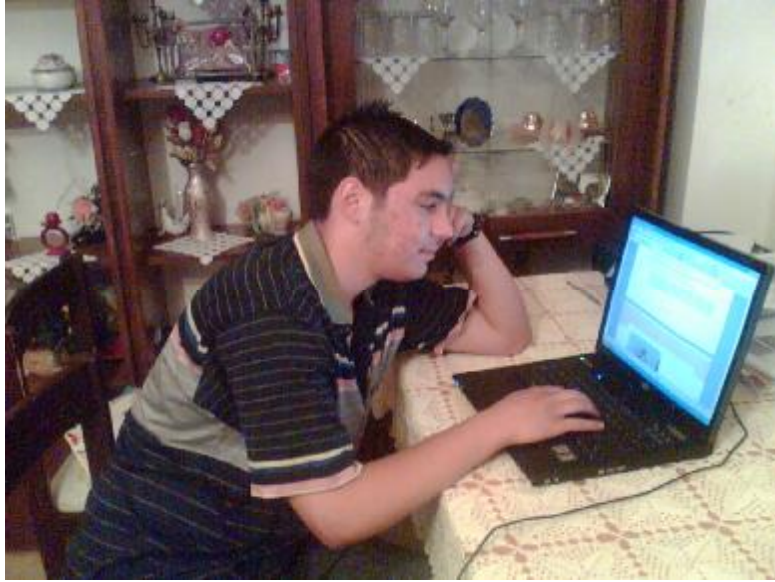
Fotoęraf 4.3: Ergenlik dönemi duygusal oluşumların gerçekleştięi süreçtir

Yeterli ve dengeli beslenme ergenlik dönemi çocuklarının saęlığı, fiziksel büyüme, duygusal, sosyal, zihinsel gelişme ve olgunlaşma açısından önemlidir. Dięer gelişim dönemlerinde olduęu gibi yeterli, düzenli, ekonomik ve saęlıklı beslenme esastır.