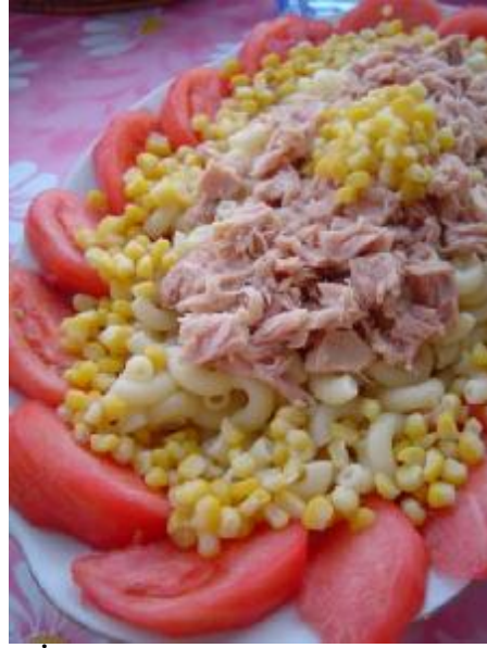
Fotoğraf 2. 5: İlk yaşlarda bir servis kaşığı makarna verilebilir