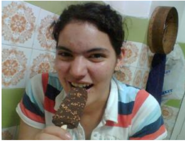
Fotoğraf 4.5 : Ergenlik döneminde bol kalorili yiyecekler sevilir ve tercih edilirken aynı zamanda zayıf kalmak istenir

Ergenlik döneminde yetersiz ve dengesiz beslenme problemleri arasında şişmanlık (obezite) ve daha çok kızlarda görülen anorexia nervosa( psikolojik kaynaklı yemek yememe ) yer alır. Fast-food ( ayakta hızla yenilen hamburger, pizza, kola vb. tüketimi şeklinde, ayaküstü beslenme ) beslenme bol kalorili olduğu için şişmanlığa yol açabilir. Bol kalorili beslenmeyi sevmesine, tercih etmesine karşı; gençler zayıf kalmak isterler. Çünkü beden algısı konusunda hassastırlar. Güzel ve yakışıklı olmanın zayıf olmak anlamına geldiğini düşünerek magazin kültürünün de etkisi ile erken yaşta zayıflama diyeti yapmaya başlayabilirler. Hiç yememe, idrar söktürücü, kusturucular kullanarak kilo vermeye çalışırlar. Böyle davranılması enfeksiyonlara direnci azaltır. Boy artışının yavaşlamasına yol açabilir.