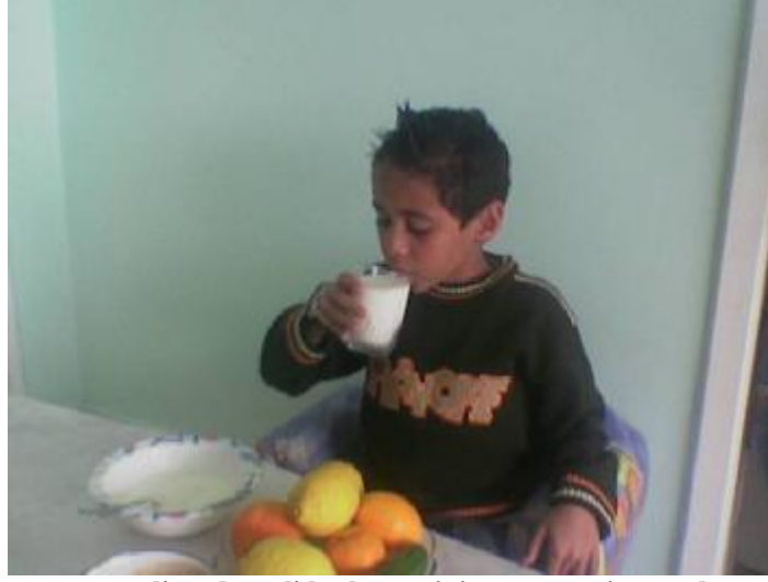
Fotoğraf 3.2 : Çocuğun yeterli ve dengeli beslenmesinin göstergesi, onun büyüme ve gelişmesidir