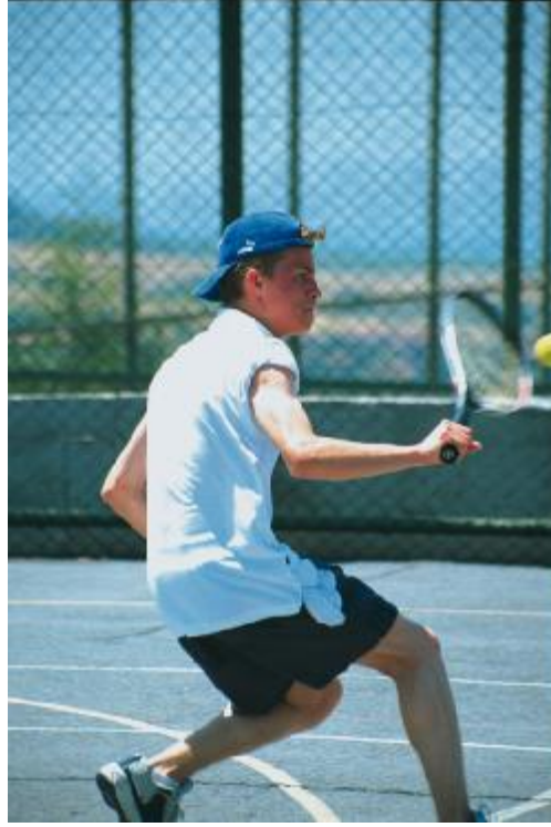
Fotoğraf 4.4: Günlük enerji ihtiyacı fiziksel aktivite ile ilgilidir

Alınması gereken en az protein miktarı, kız-erkek 0,8 mg/kg/gün ( günde kilogram başına 0,8 gr ) olarak kabul edilir. Bunun yarısından çoğu süt,yumurta,et gibi biyolojik değeri yüksek , örnek protein niteliğinde olmalıdır.Yeterli miktar enerji ,protein ve özellikle örnek protein alınan beslenmede tüm besinsel öğelerin alındığı varsayılır. Ek olarak vitamin ve minerallere de yer verilmelidir.