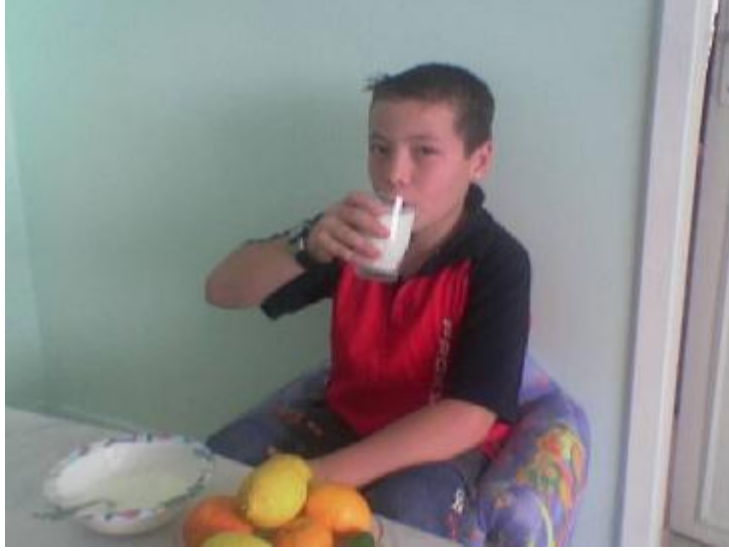
Fotoğraf 3.1: Okul çocuğunda yeterli ve dengeli beslenme önemlidir.