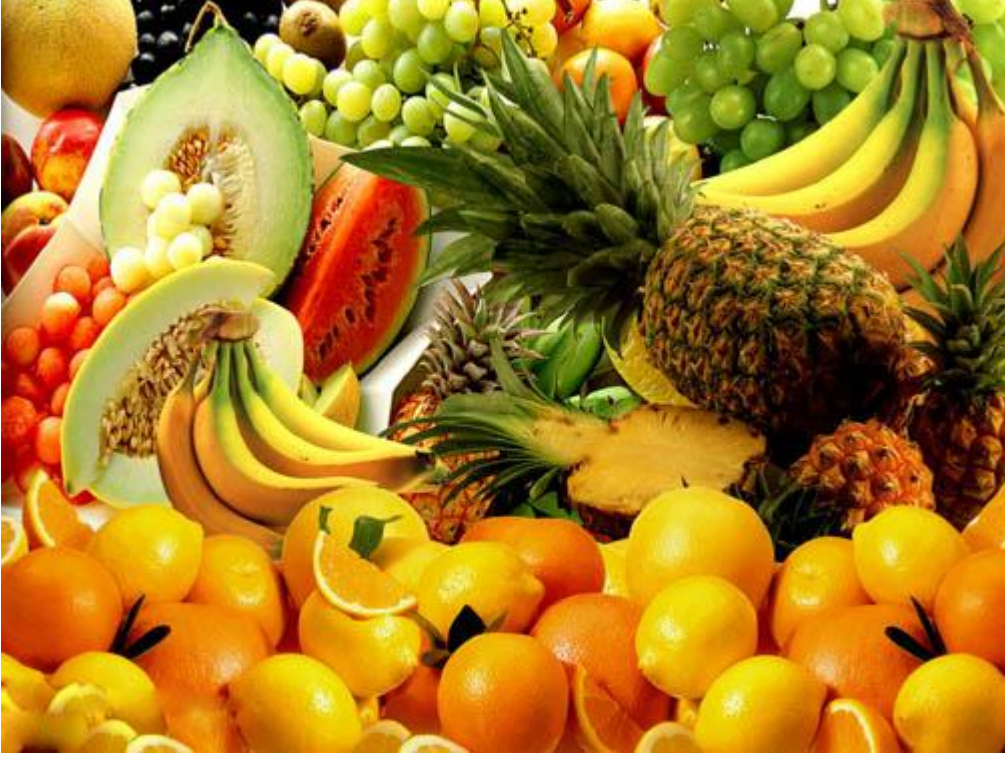
Fotoğraf 5.6: Ergenlik döneminde bütün besin grupları yeterli ve dengeli olarak günlük menüde yer almalıdır