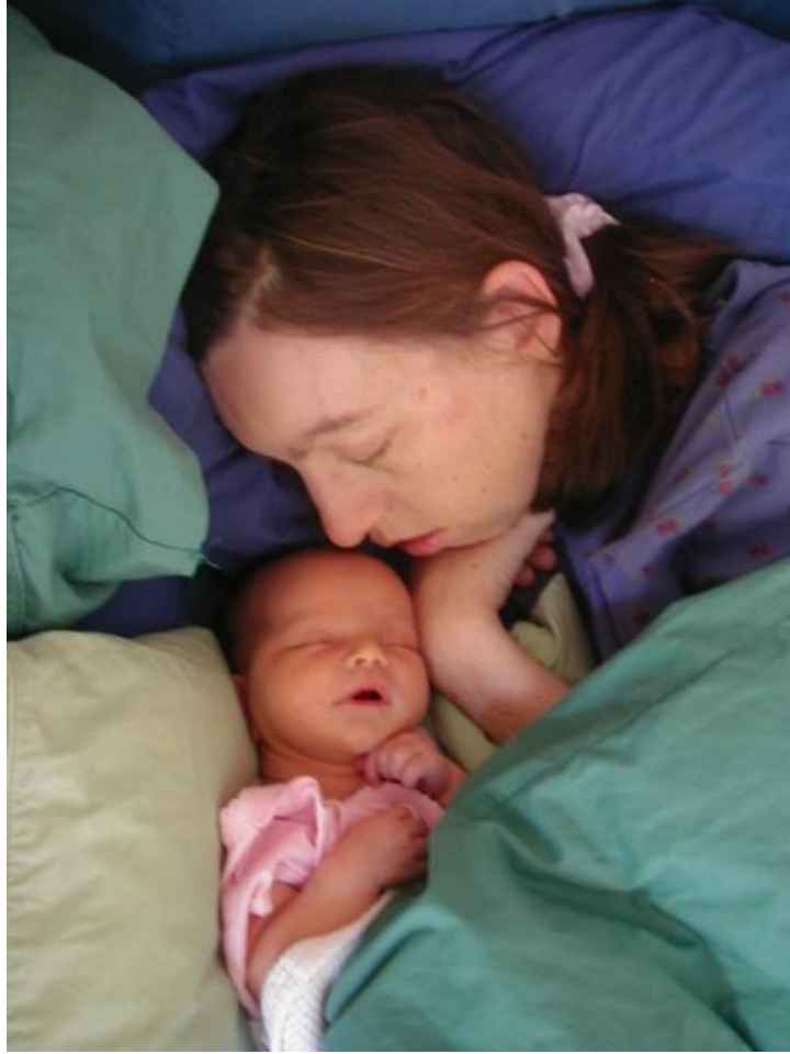
Fotoğraf 1.5: Anne sütü ile beslenme, anne bebek arasındaki duygusal bağı geliştirir