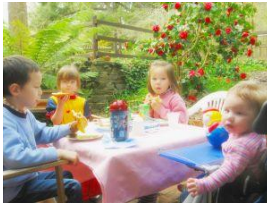
Fotoğraf 2.6 : Beslenme alışkanlığı ancak iyi bir eğitimle yerleştirilebilir

Okul öncesi dönemde çocuğun tükettiği besin miktarı kadar yeni gıdalara alışması da önemlidir. Okul öncesi dönem gıda alışkanlıklarının kazanıldığı hoşlanılan ve hoşlanılmayan gıdaların belirlendiği dönemdir. Bu dönemde iyi beslenme alışkanlıklarının kazandırılması ile çocuk yaşamı boyunca doğru ve dengeli beslenebilir.