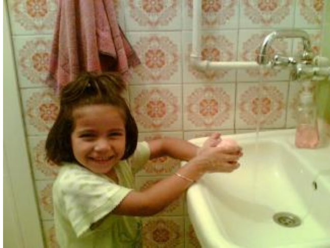
Fotoğraf 2.7 :Yemek öncesi ve sonrası kişisel temizlik öğretilmelidir