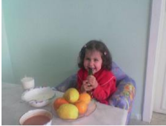
Fotoğraf 2.2.: Oyun dönemi yeni beslenme alışkanlıklarının kazanıldığı dönemdir

Oyun çocuğu beslenmesinde temel ilke; büyüme ve gelişme özelliklerine uygun çeşit, miktar ve kıvamındaki besinleri seçerek karşılamak; iyi beslenme alışkanlıkları kazandırmaktır. Bu bakımdan çocukların yemek yeme alışkanlığını kazanmasında ailedeki büyüklerin özellikle de annenin tutumunun çok önemli bir yeri vardır. Çocuk büyüklerin tutumundan etkilenir. Sofrada çocuğun yanında yemeklerin hep iyi olduğu söylenmeli, huzursuzluk çıkarmamalıdır. Çocuğun şiddetle yemek istemediği yiyecekleri vermekte ısrar etmek doğru değildir. Yemek yeme konusunda çocuk ile büyükler arasında meydana gelen anlaşmazlıklar; annelerin belli saatlerde ve fazla miktarda yiyecek yedirme isteklerinden kaynaklanır. Anneler çocuklarını başka çocuklarla kıyaslarlar. Çocuklar arasında bireysel farklılıklar olduğu unutulmamalıdır. Yemek sofrası pazarlık ve savaş meydanı olmamalıdır.